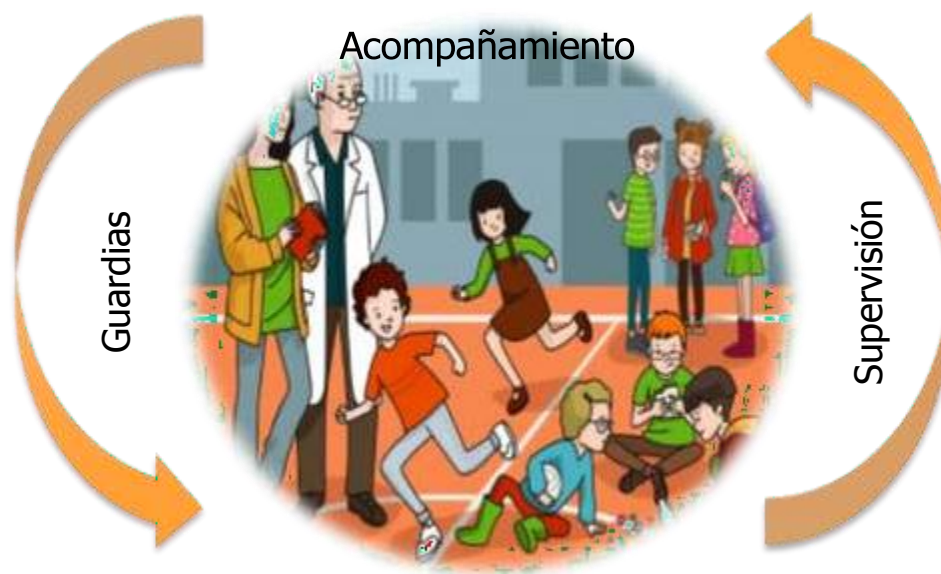
Figura 4. Categoría III. El Acompañamiento Docente en el Recreo Escolar

Por lo tanto, sin la motivación y el acompañamiento docente, el tiempo de recreo se convierte en una desorganización total; apostar por cronogramas de supervisión, atención de áreas y planificación de juegos son elementos básicos con los que debe contar toda institución educativa para garantizar el espacio recreativo, ya que se trabaja con base en lo pedagógico y lo organizativo; además se consolidan procesos emocionales, afectivos y sociales que se dan lugar en toda la recreación escolar.