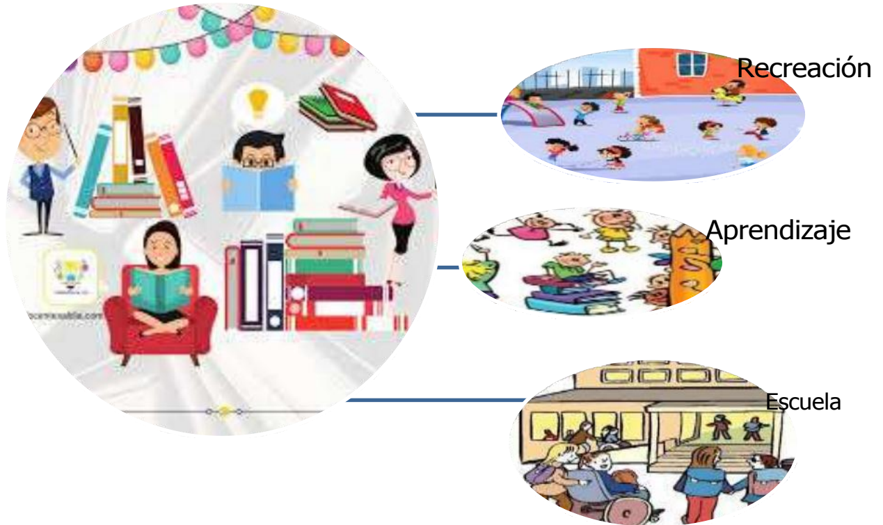
Figura 7. Percepción pedagógica del recreo para los docentes