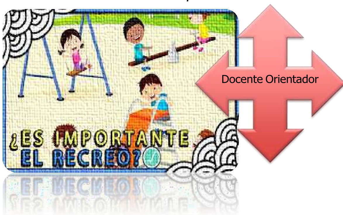
Figura 5. El rol del docente como orientador en el tiempo del recreo.

Por lo cual es ineludible valorar el recreo, hacerlo importante y trascendental, ajustar los espacios, disponer de equipamiento, formar al personal y construir una cultura del recreo como una opción de muchos beneficios para todos los estudiantes del centro educativo. Es imperioso, que la institución reconozca que el recreo es parte del aprendizaje de los niños y no un tiempo de ocio mal invertido, se debe dejar de ver al recreo como una ruta de escape de las actividades escolares, porque el recreo forma parte de la esencia misma del ser humano en la construcción de su personalidad.