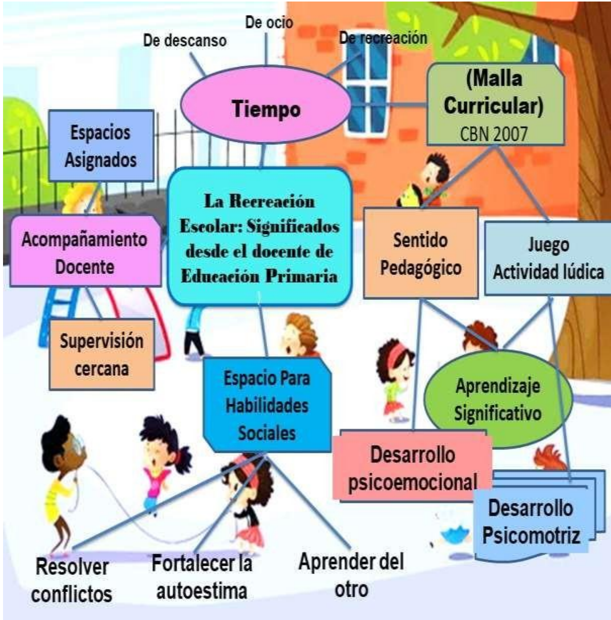
Figura 10. Ecos timbrados en la Investigadora

dinámicas grupales y actividades recreativas; e inclusive han abogado por la participación de aquellos escolares en situación de discapacidad.