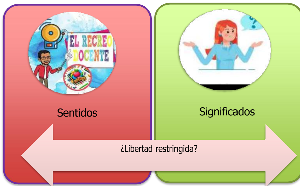
Figura 3. Sentidos y significados del recreo para los docentes