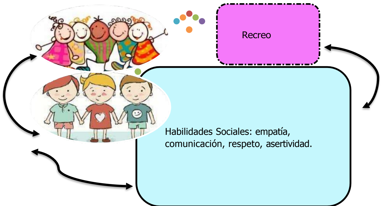
Figura 9. El recreo como escenario posible para el desarrollo de las habilidades sociales

acaecidos en todos los escenarios del mundo comenzó a adquirir mayor atención. Así, en la U.E Instituto “Madre María” también se planteó la interrogante acerca de cómo abordar a los estudiantes desde las diferentes áreas formativas y de los hábitos, puesto que, en lugares destinados para el recreo, se había desdibujado la capacidad de entender al otro.