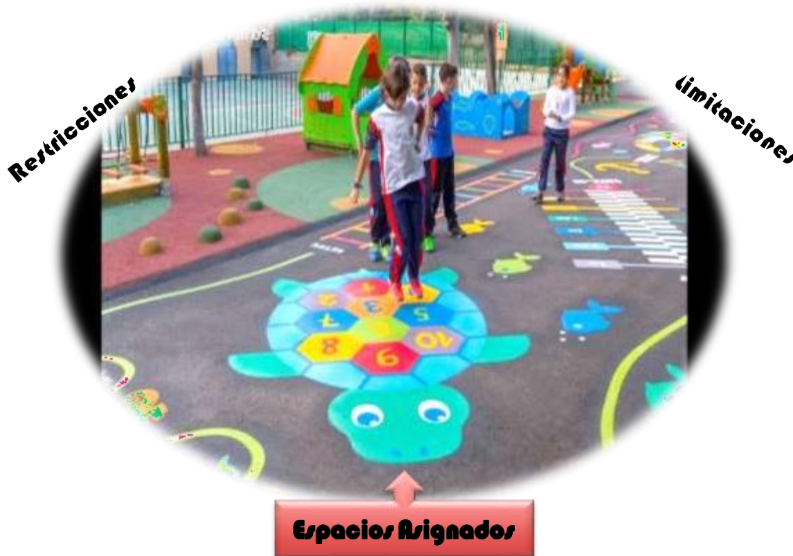
Figura 6. IV Categoría. Necesidad de Espacios Físicos

Otra versión que respalda la necesidad de que en la escuela se asignen espacios ideales en los patios de recreos y permitan el movimiento de los estudiantes es la que plantea EV4ChE: “Si nosotros tenemos a los niños como en los espacios que están asignados, él no va a poder socializar, él no va a poder socializar con otros niños y compartir con otros niños”. (L13-15).