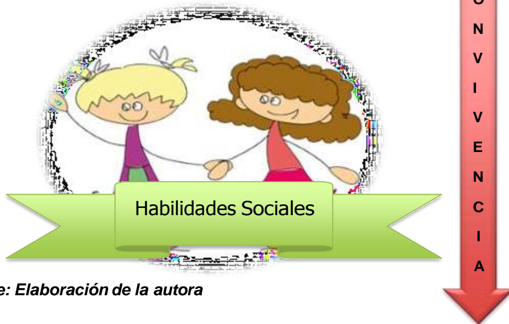
Figura 8. V Categoría. Promoción de Habilidades Sociales y Convivencia en el Recreo

aprender de la mano y guía de todos los agentes educativos y corresponsables del hecho educativo.