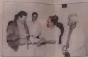
Gobernador Silveira bautizó "Libro del Sabio Torrealba"