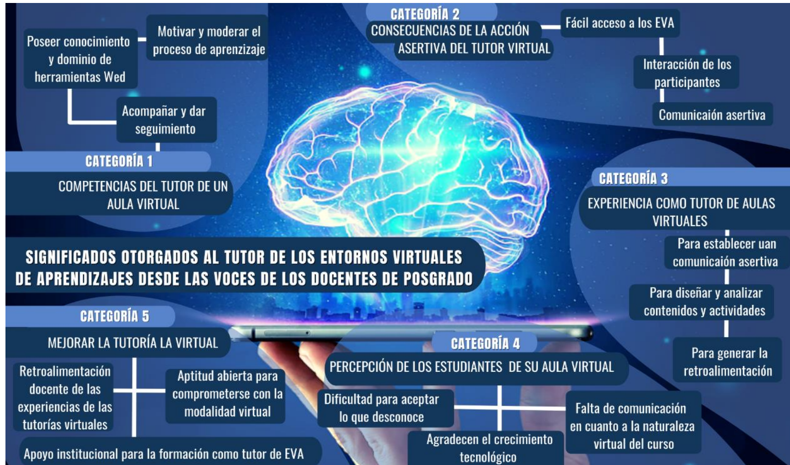
Grafico N°1: Sistematización de las categorías y subcategoría.