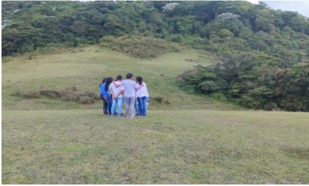
Grupos organizando penitencias para equipos contrarios.