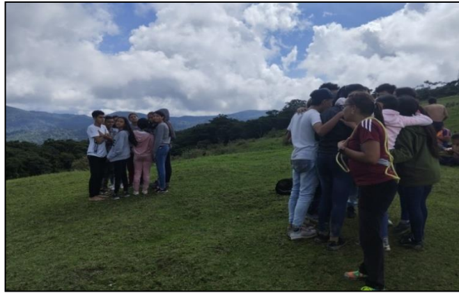
Mientras unos conversaban para llegar a acuerdos otros observaban