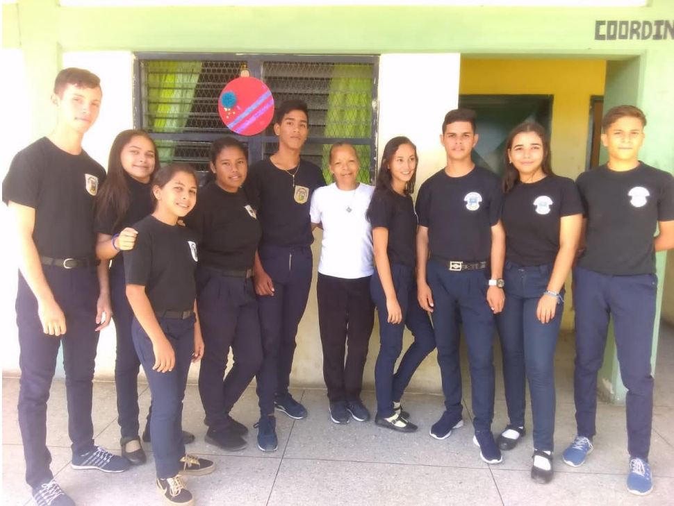
Grupo de estudiantes que formaron el equipo de seguridad estudiantil