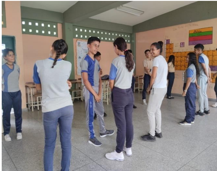
Palabra positiva de un estudiante a otro.