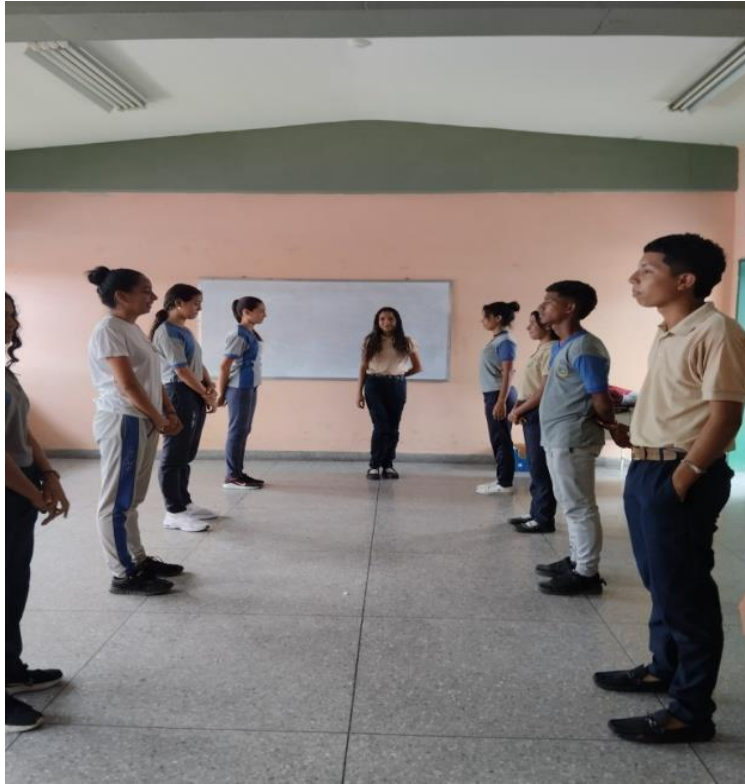
Formación de filas para recorrerla y dar palabra de motivación.