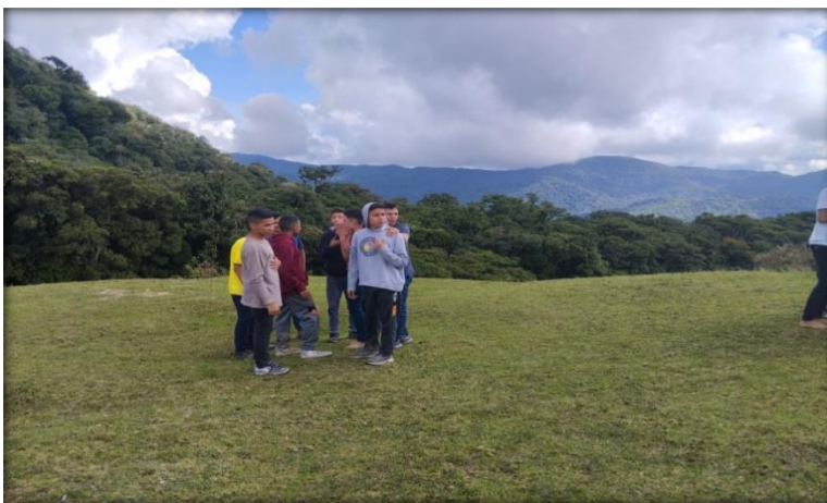
Algunos grupos ya listos esperando por los otros.