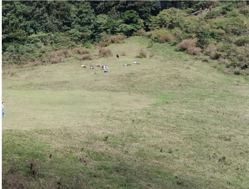
A rodar al ritmo de la adrenalina para cumplir su penitencia.