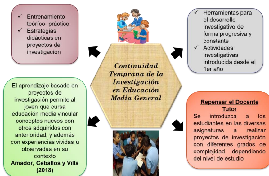
Gráfico 8: Continuidad temprana de la investigación en educación media general

Por este motivo, es necesario que la metodología investigativa sea introducida desde que el estudiante entra en la educación media y de esa manera cuando llegue a 5to año no exista preocupación de un proyecto durante su ejecución, este tenga las habilidades y destrezas necesarias para desarrollar esta actividad y de esa manera la labor del tutor sea más fácil. Al respecto reflexiono, que en las instituciones educativas debe implementarse una estrategia estructurada y debidamente orientada que permita la construcción del conocimiento de la metodología de investigación de manera sucesiva para lograr un aprendizaje acorde con las exigencias actuales.