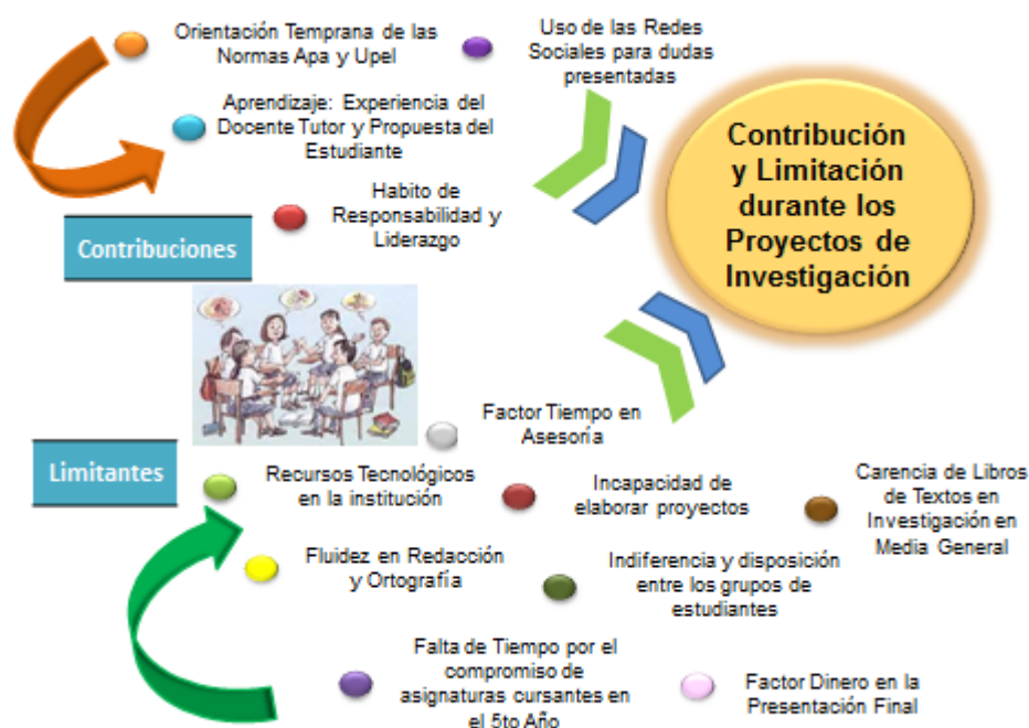
Gráfico 3: Categoría III: Contribución y Limitación durante los Proyectos de Investigación