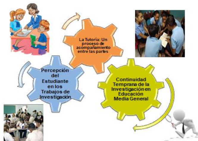
Grafico 5: Reflexiones de los Hallazgos desde la mirada de los Docentes Tutores

De este modo, proyecté la construcción de un cuerpo de reflexiones sobre la base del proceso de triangulación entre quienes escriben, mi visión y las voces de los actores sociales, iniciando desde un proceso de interpretación hasta llegar lo más próximo posible a dicha realidad. La construcción generada en la presente investigación partió de la transcripción de los protocolos, división de los contenidos en categorización descriptiva, construcción de subcategorías, a partir de las cuales se establecieron relaciones vislumbradas entre las mismas posteriormente a su contraste con las teorías base. Partiendo de lo anterior, establecí tres hallazgos los cuales emergieron de las categorías y subcategorías abordadas en el momento anterior. A continuación desarrollaré los hallazgos percibidos en esta realidad social que abre aristas a las reflexiones del presente estudio: