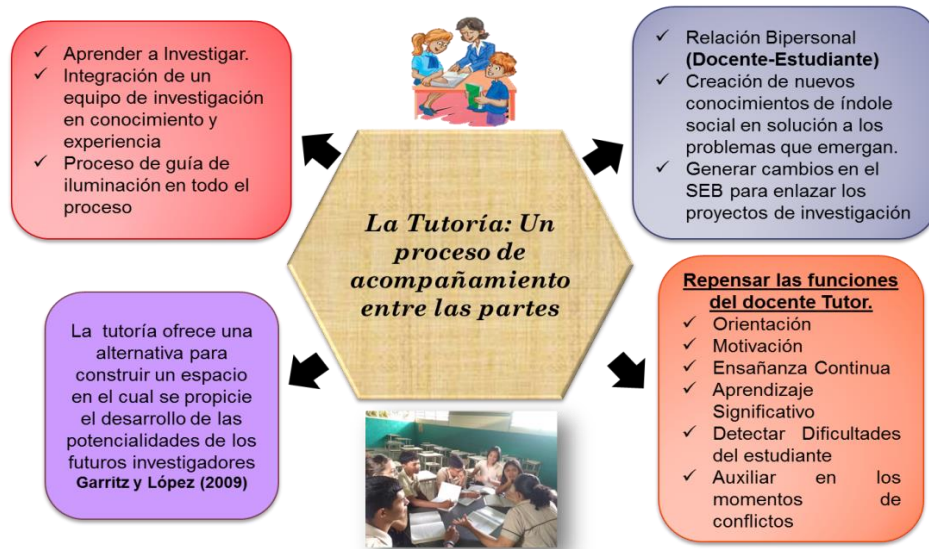
Gráfico 6: La tutoría: un proceso de acompañamiento entre las partes

o problemas que se puedan generar en este camino, es por ello, que el buen accionar de una tutoría resulta ser muy importante, porque la misma permite evitar malas decisiones, equivocaciones metodológicas, apatías e incluso abandono del proceso investigativo.