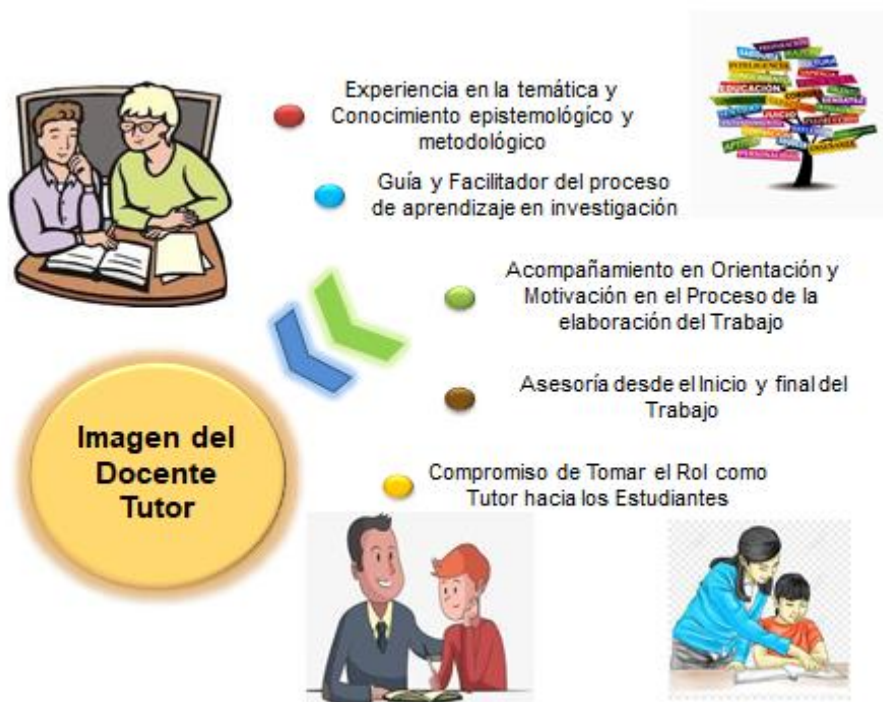
Gráfico 1: Categoría I: Imagen del Docente Tutor

mismo y bajo aprovechamiento de los recursos y de los resultados obtenidos en función de la sustentabilidad del proceso.