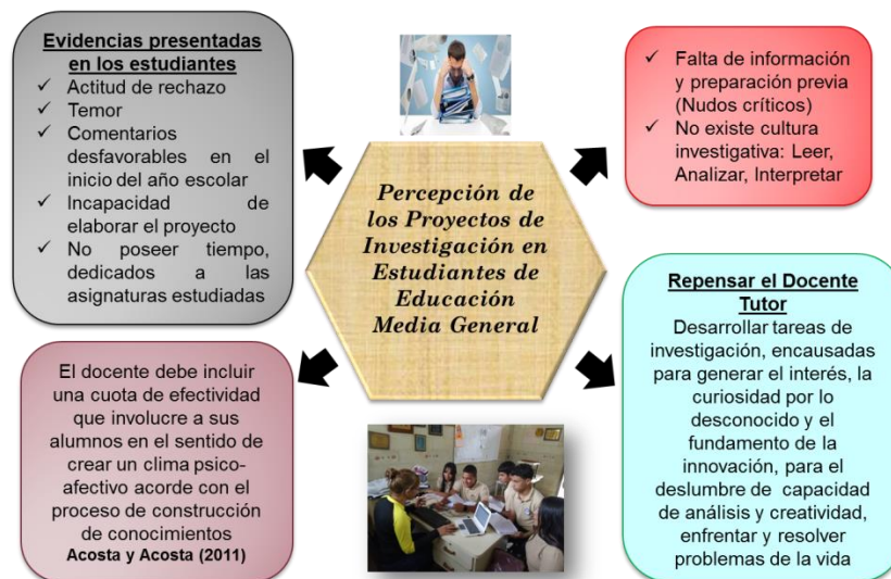
Gráfico 7: Percepción de los proyectos de investigación en educación media general

En los testimonios generados por mis actores, orientaron a la reflexión que existe una tendencia desfavorable a elaborar los proyectos de investigación por los estudiantes de 5to año, hay en ellos una predisposición de no querer realizarlos debido a la falta de información y preparación previa para ello, se observa como a los estudiantes no les gusta leer, analizar, interpretar, ni realizar actividades de índole investigativa, lo cual hace más difícil la labor que desempeña el docente tutor en tratar que se establezca empatía o una relación afectiva y conductual con este tipo de trabajo. Igualmente los estudiantes manifiestan que no les motiva realizar investigaciones para ejecutar sus proyectos porque sienten no tener conocimientos suficientes y esto lo considera como un obstáculo y temen no poder desarrollarlo. En tal sentido, como tutores debemos incentivar una actitud favorable para despertar el interés de los tutorados en abordar la investigación y adquirir los conocimientos y habilidades necesarias para hacer un buen informe escrito y una exposición oral de calidad.