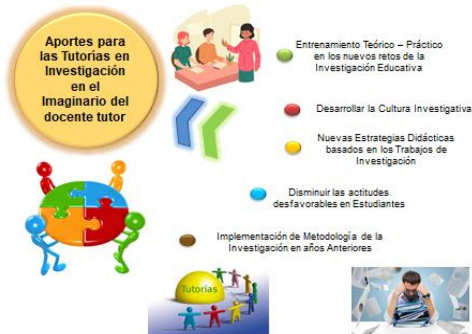
Gráfico 4: Categoría IV: Aportes para las Tutorías en Investigación en el imaginario del docente tutor