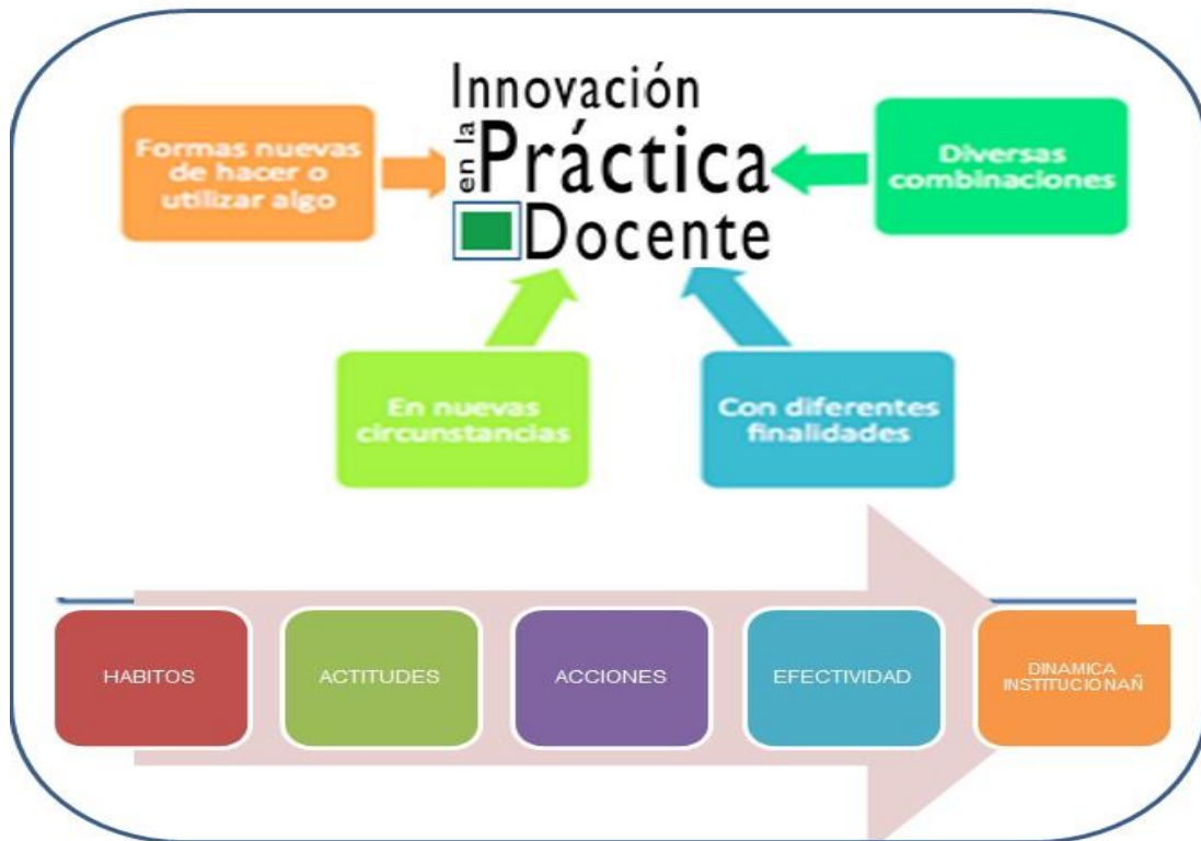
Grafico 5: Innovación educativa de Educación Primaria.

pueden ser, precisamente, implementadas en el ámbito pedagógico, a manera de alternativas para variar tanto las estrategias como los esquemas cotidianos con los cuales se imparten los conocimientos.