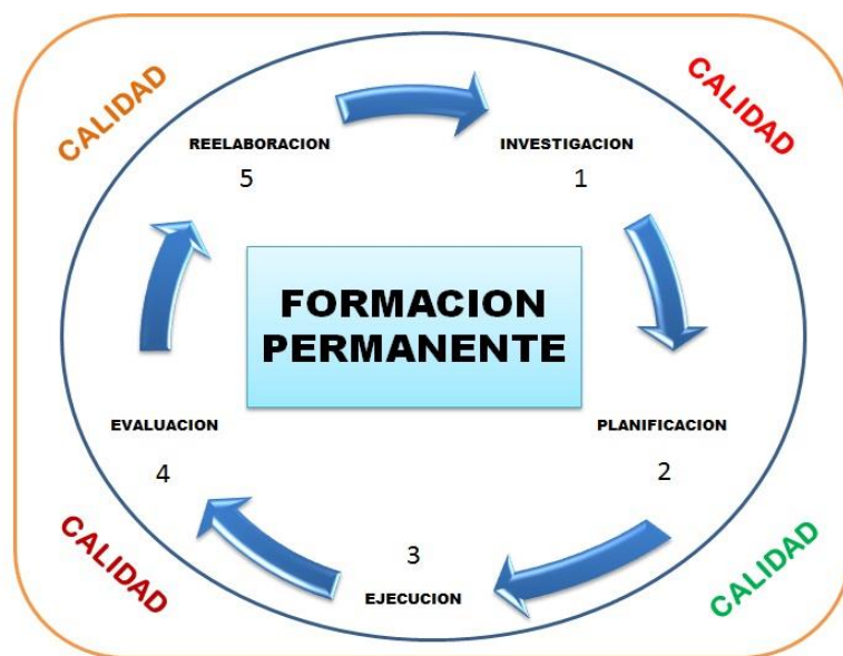
Grafico 4: Formación permanente de Educación Primaria.

La formación permanente del docente en los últimos es uno de los componentes con mayor énfasis dentro del contexto educativo, puesto que se propone el desarrollo de un proyecto educativo como la principal herramienta, por cuanto su elaboración requiere de un proceso que comprende: investigación, planificación, ejecución, evaluación y reelaboración constante. Con esta finalidad, se amerita el apoyo de todos los actores que hacen vida en la institución, desde la gerencia de sus directivos, con la experiencia y la claridad que obedece la consecución del proyecto escolar, como las estrategias que le permitan al docente convertir la práctica pedagógica en la verdadera fuente de formación permanente a través de experiencias metodológicas basadas en la investigación acción, como tendencia pedagógica que actualmente emana el MPPE.