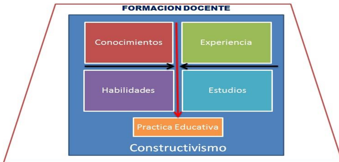
Grafico 3: Concepciones pedagógicas de Educación Primaria. Fuente: Rivas (2015)

manifiesta a través de una visión integral de la educación, sus límites, contradicciones, lo cual determina la práctica de su función, fortaleciendo o afectando directamente el papel que reviste, aun cuando el éxito depende de variados aspectos que intervienen y rodean la labor.